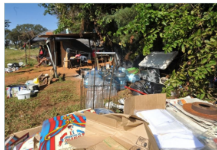
Catadores de lixo, que vivem acampados em área próxima à Universidade de Brasília (UnB) que fica a menos de 10 quilômetros da Esplanada dos Ministérios. Pelo menos um das famílias que estão neste local recebe benefício do programa Bolsa Família